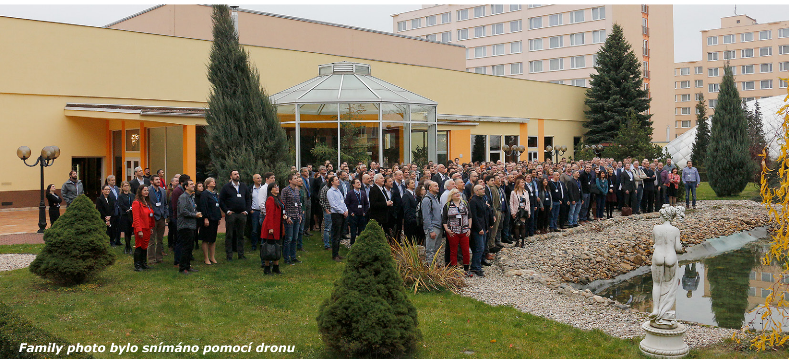
Family photo bylo snímáno pomocí dronu

Konference MARS byla svým obsahem skutečně obsažná. Ukázala a potvrdila, že inovace a nové technologie jdou neuvěřitelně rychle kupředu a že budou přínosem nejenom pro platební agentury, ale i pro farmáře samotné. Krátké video z průběhu konference lze zhlédnout ZDE .