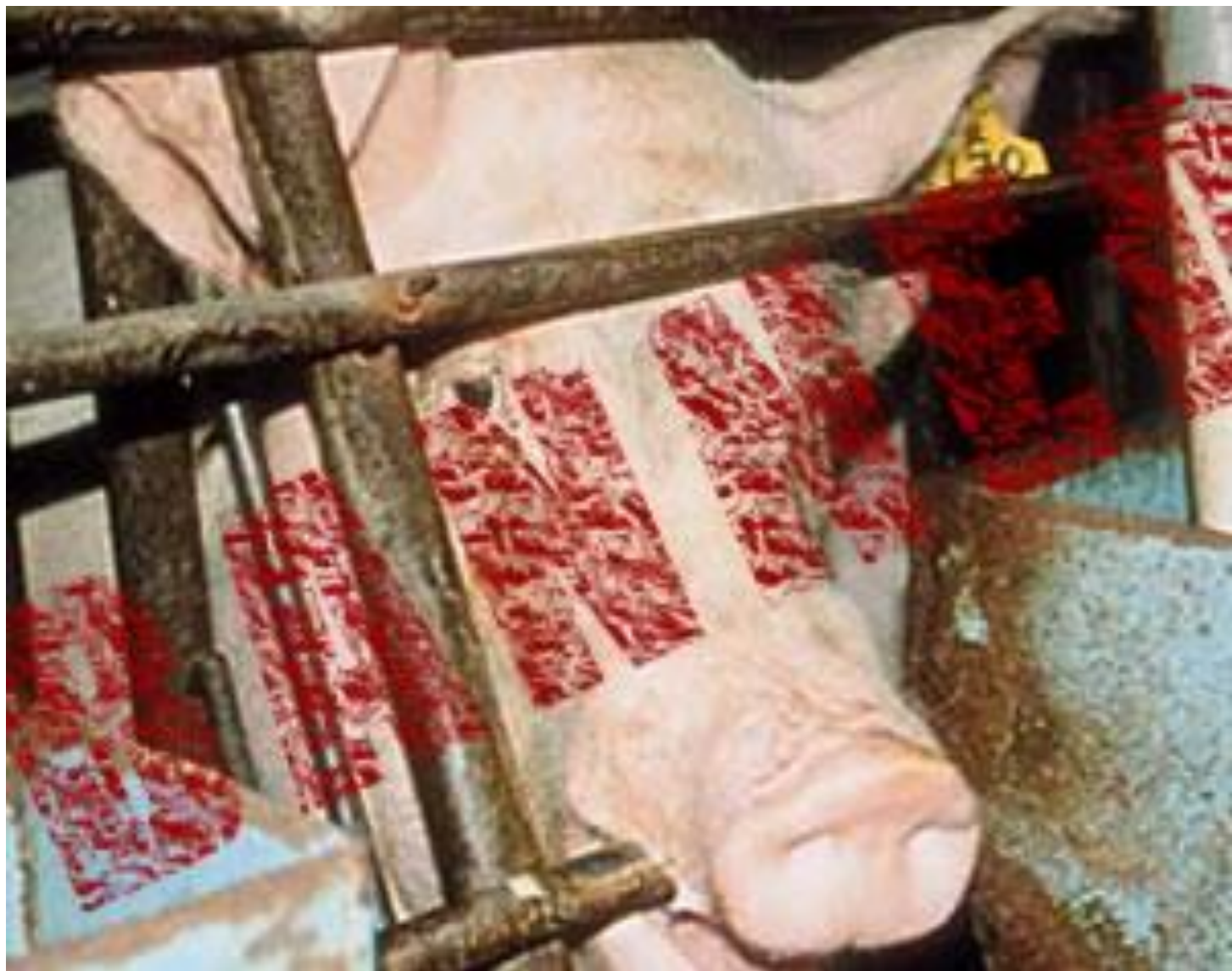
Částečný zákaz kotců pro březí prasnice od roku 2013