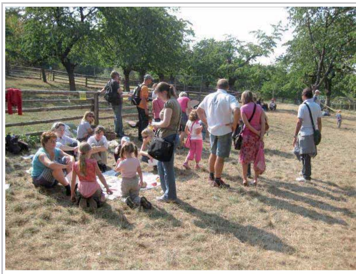
Ekozemědělské hry pro děti pořádané PRO-BIO LIGOU na Biojarmarku na Toulcově dvoře