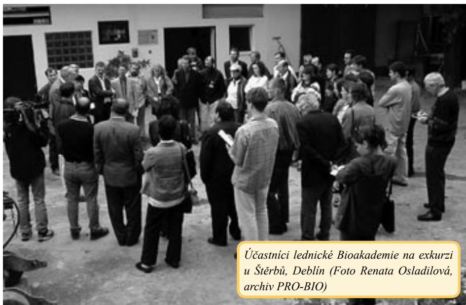
Účastníci lednické Bioakademie na exkurzi u Štěrbů, Deblín