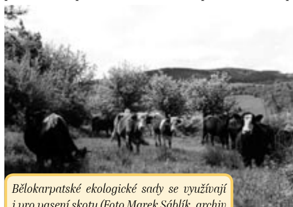
Bélókarpatské ekologické sady se využívají i pro pasení skotu