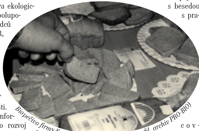
Biopéčivo firmy K+K Blansko