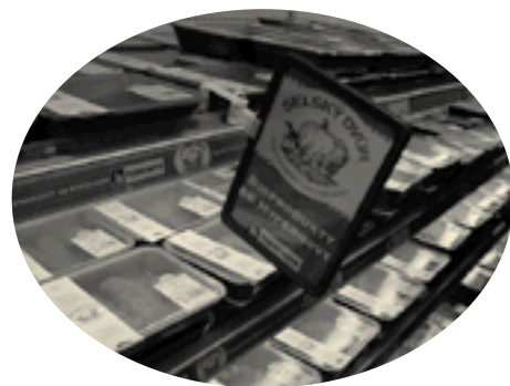
Biohovězí od členů svazu (Ekodružstvo Severozápad) se pravidelně objevuje na pultech hypermarketů