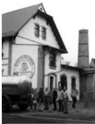
Ekozemědělci z PRO-BIO na exkurzi u kolegů v Sasku, výroba kozího sýra

• Schůzky a individuální návštěvy farem – funguje bez problému, průzkumovým listkem zasláným farmářům se potvr-