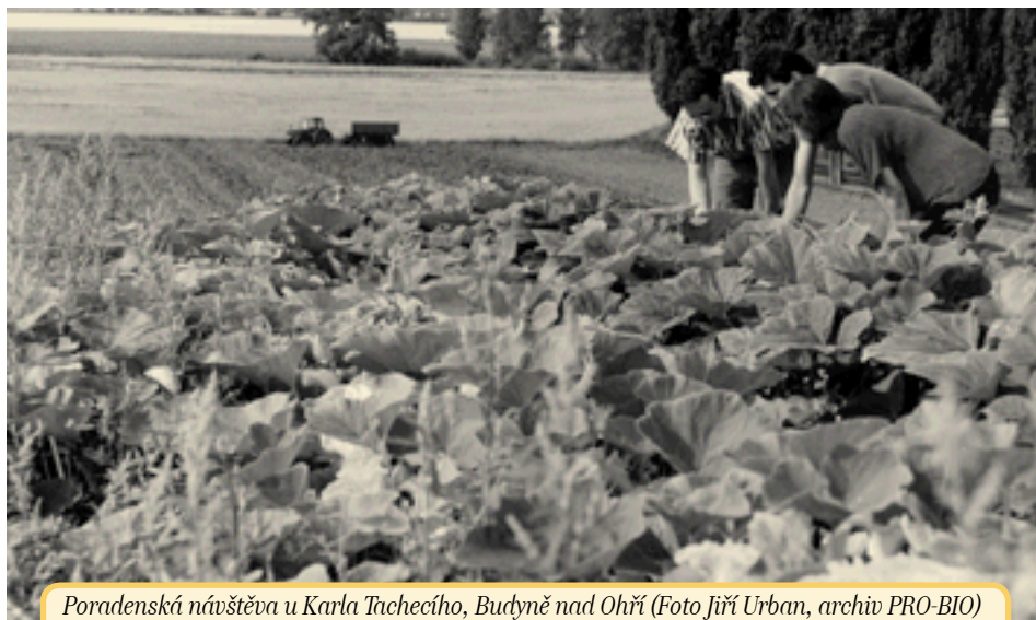
Poradenská návštěva u Karla Tichého, Budyně nad Ohří

formou dotací na základě podpůrných programů stanovených podle § 2 odst.1 zákona č. 252/1997, o zemědělství pro rok 2001), takzvané poradenské kroužky. Z důvodu nižší úhrady nákladů na poradenství ze strany MZe, která činila 47,51 %, byl zájem ze strany zemědělců poměrně nízký. Přesto při regionálních centrech svazu PRO-BIO pracovalo celkem 6 poradenských kroužků (RC Bílé Karpaty, RC Šumava, RC Třebíč, RC Jeseníky, RC Severovýchod a RC Litomyšl), do kterých se zapojilo 86 zemědělských subjektů a uplatnilo 119,5 bodu, což znamená, že byla v rámci kroužků provedena poradenská služba v celkové hodnotě 2.390.000,- Kč. Činnost kroužků byla však omezena v tom, že mohly sdružovat pouze zemědělce ze tří sousedících okresů. Proto byla část našich členů zapojena do kroužků při Agrárních komorách, případně jiných poradenských organizacích, avšak využívala služeb smluvních poradců PRO-BIO. V kroužcích bylo vedle poradenství týkajícího se kontroly a registrace řešeno i poradenství odborné, a to zejména v oblasti pěstování netradičních plodin a chovu masného skotu a ovcí.