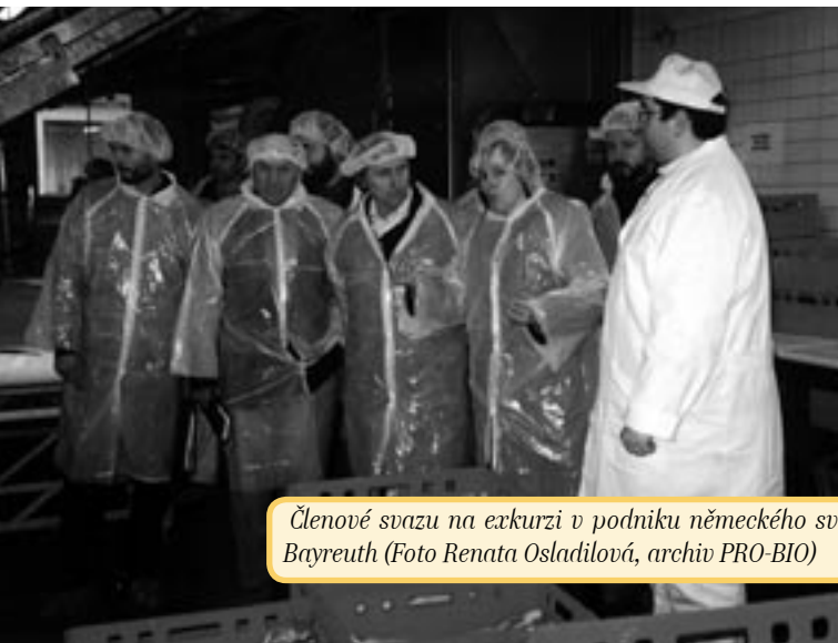
Členové svazu na exkurzi v podniku německého svazu Bioland: jatka Wölfel, Bayreuth

V rámci tohoto národního grantu podpořeného pražskou pobočkou regionálního ekologického centra REC byl ustanoven tým odborníků, vypracována argumentační studie. Tato studie shrnuje legislativní rámec pro podpory EZ v Evropě, uvádí konkrétní příklady v jednotlivých zemích, představuje akční plány rozvoje EZ a nastiňuje možnosti pro ČR. Souhrn studie vyšel v reprezentativní formě v časopise „Euro magazin“.