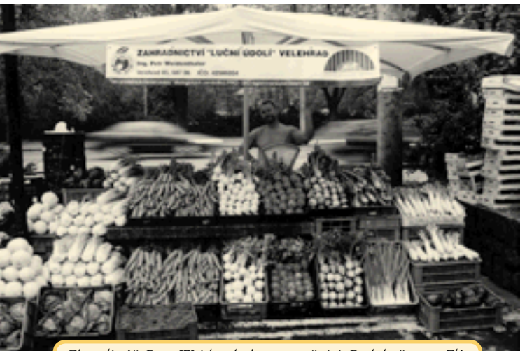
Ekozelinař Petr Weidenthaler na tržnici Pod kaštany, Zlín

kého zemědělství po celé České republice. Zpráva o sekci prodejců biopotravin viz dále.